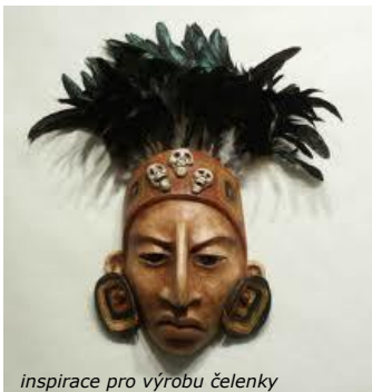
inspirace pro výrobu čelenky

Pokud si chceš prohlédnout více obrázků a nechat se inspirovat, doporučujeme podívat se na internet. Zkus dát vyhledat například heslo mayan warrior .