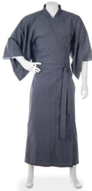
Strana 3 (celkem 8)

Do čtvrtka 22. 6. (nejlépe v 19 hodin po schůzce) je nutné, aby skauti přinesli zabalené věci, které chtějí odvést na tábořiště. Zavazadla vlčat přineste na sraz 7. 7. na nádraží.